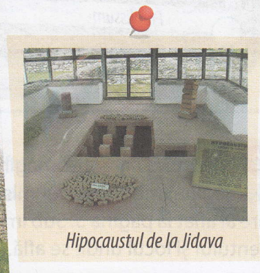
Hipocaustul de la Jidava