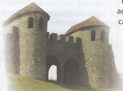
Poarta orașului roman Porolissum