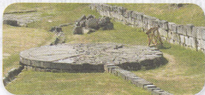
Discul de andezit

Discul de andezit (piatră) de la Sarmizegetusa Regia este unul dintre cele mai misterioase locuri din cetatea dacilor. El reprezintă o platformă rotundă, formată din blocuri de andezit, așezate în forma razelor Soarelui. Scopul acestei construcții a rămas necunoscut până în zilele noastre.