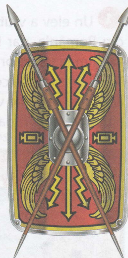
Scut și sulițe romane

În sud-estul provinciei Dacia, de-a lungul Oltului, romanii au construit o graniță fortificată cu ziduri, caestre și turnuri de veghe, numită limes transalutanus . Unul dintre caestrele care s-au păstrat până astăzi este cel de la Jidava (sau Jidova), în apropierea orașului Câmpulung Muscel. Se pot vedea zidurile și turnurile de apărare (reconstituite), urmele locuințelor soldaților și ale ofițerilor, căile și porțile de acces în castru.