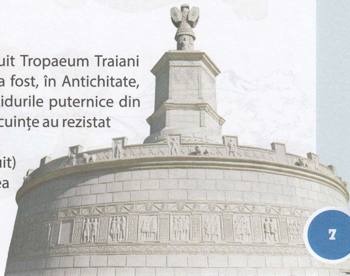
Monumentul Tropaeum Traiani, Adamclisi

Tot aici se află monumentul (azi, reconstituit) ridicat, din ordinul împăratului Traian, în cinstea soldaților romani care au luptat cu dacii.