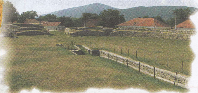
Ruinele amfiteatrului roman