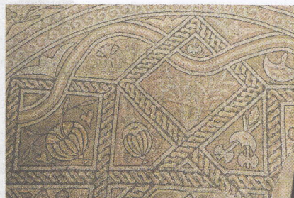
Mozaic de la Tomis (fragment)

Orașul Tomis , Constanța de azi, a fost înființat tot de grecii veniți din Milet. Urmele din perioada greacă și romană se pot vedea și astăzi. Un monument deosebit este Edificiul (clădirea) cu mozaic . Aici poate fi admirat unul dintre cele mai mari mozaicuri romane din lume, păstrat până azi.